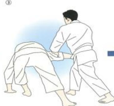
③取りは受けの腕を腹の高さまで下げ、手首をつかむ。受けは身体の向きを変えながら、片手を畳につける。