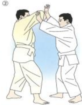
②取りは送り足で進み、相手の肘をつかむ。