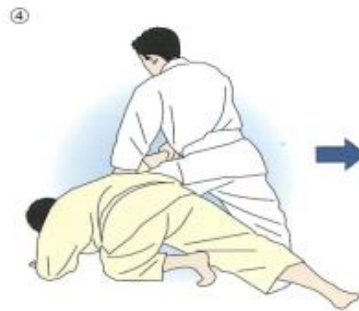
④取りは歩み足で1歩進む。受けは前腕や膝も畳につける。