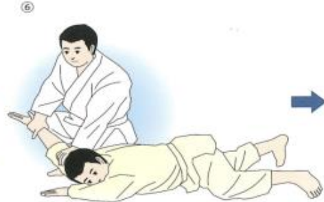
⑥取りは相手側の膝をつく。受けはうつ伏せになる。