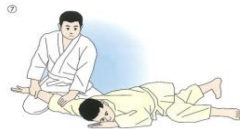
⑦取りは両膝をつき、跪座になる。