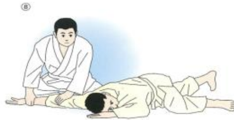
⑧取りは相手の腕全体を畳につけるように抑える。