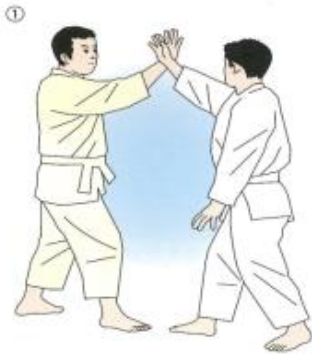
①相半身の構えで手刀を合わせる。