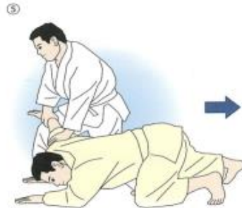
⑤取りはさらに歩み足で1歩前進する。